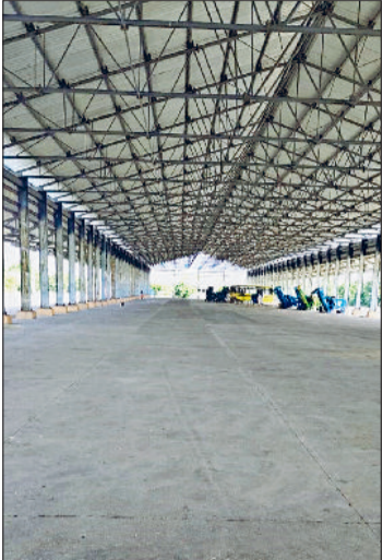
फतेहाबाद। धान की खरीद लेकर अनाजमंडी में चकावक करवाया गया शैड।

इस बार शुक्रवार से राइस शैलरों का पंजीकरण शुरू हुई तो कागजी कार्रवाई अधिक होने के कारण पोर्टल पर अधिक समय लग रहा है। इस बार प्रदेश सरकार ने ए ग्रेड परमल धान का न्यूनतम समर्थन मूल्य तय किया है। इसके तहत हैफेड, डीएफएससी व वेयर हाउस किसानों का 17 फीसदी नमी वाला धान खरीदेंगे। सरकार ने धान खरीद की तिथि 1 अक्टूबर से निर्धारित की है। हालांकि उम्मीद की जा रही है कि धान की खरीद पहले ही शुरू हो जाएगी। सरकार ने