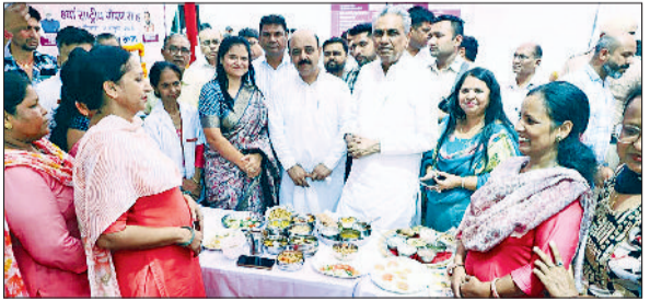
फतेहाबाद। स्वस्थ नारी सशक्त नारी अभियान के तहत नागरिक अस्पताल में आयोजित कार्यक्रम का शुभारंभ करते अतिथिगण।