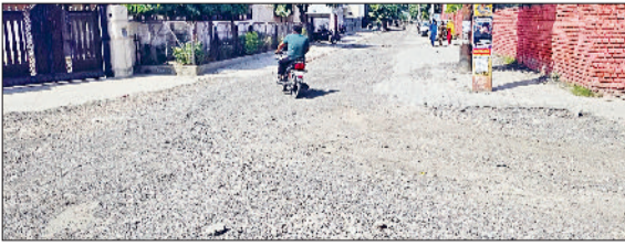
फतेहाबाद। मॉडल टाउन में टूटी पड़ी सड़कें।