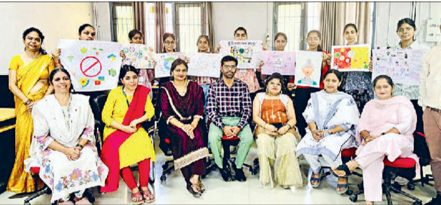
सिरसा। पोस्टर मेकिंग प्रतियोगिता की विजेता प्रचार्य के साथ।