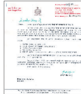
फतेहाबाद। स्वास्थ्य मंत्री आरती राव द्वारा भेजा गया पत्र।