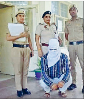
सिरसा। पुलिस गिरफ्त में आरोपी।