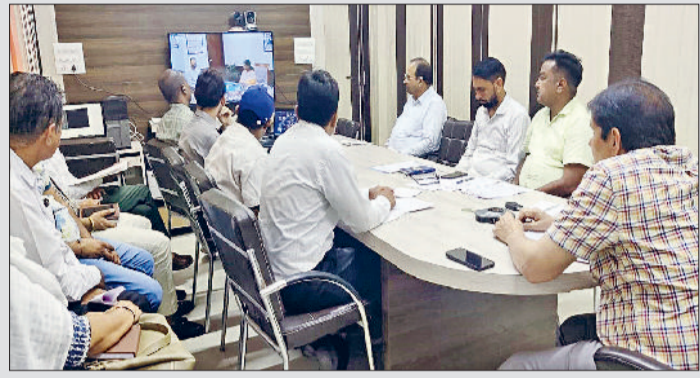
सिरसा। वीडियो कॉन्फ्रेंसिंग में भाग लेते एडीसी व अन्य अधिकारी।

एडीसी जोकि योजना के नोडल अधिकारी हैं, ने कहा कि यह योजना राज्य सरकार की प्राथमिकता में शामिल है, जिसका उद्देश्य महिलाओं को सशक्त और आत्मनिर्भर बनाना है। उन्होंने बताया कि 25 सितंबर को एप लॉन्चिंग के साथ-साथ जिले में भी कार्यक्रम आयोजित होगा। योजना का लाभ लेने के लिए लाभार्थियों के पास आधार कार्ड, फैमिली आईडी, डेमिसेसल तथा परिवार की एक लाख रुपये तक की वार्षिक आय होना जरूरी है। लाभार्थी की उम्र 23 से 60 साल के बीच होनी चाहिए।