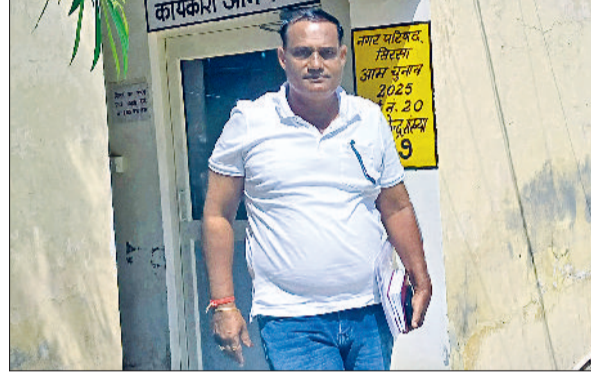
सिरसा। नगरपरिषद कार्यालय में जांच के लिए पहुंचे सीएम फ्लाइंग अधिकारी।