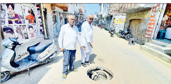
भूना। अनाजमंडी से टोहाना रोड पर टूटे हुए सीवरेज मैनहोल को दिखाते हुए व्यापारी।

टोहाना रोड से अनाज मंडी तक डाली गई नई सीवरेज लाइन अब लोगों के लिए खतरा बनती जा रही है। इस सीवरेज लाइन के कई मैनहोल के ढक्कन टूट-फूट चुके हैं, जिसके कारण हर समय किसी बड़े हादसे का भय बना रहता है। सबसे 'यादा परेशानी उन व्यापारियों और दुकानदारों को हो रही है, जिनकी दुकानें अनाज मंडी रोड पर स्थित हैं। उनका कहना है कि कई बार मार्केटिंग बोर्ड के